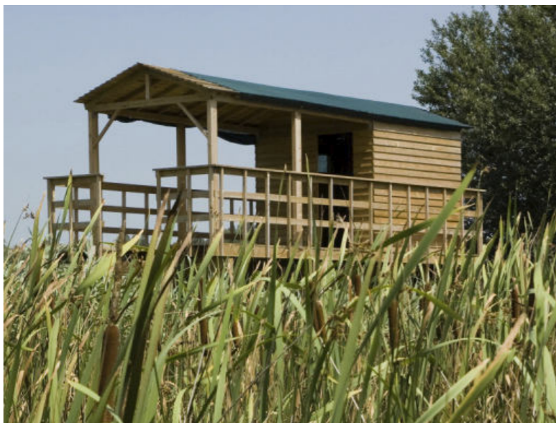
Observatório de aves - modelo 1